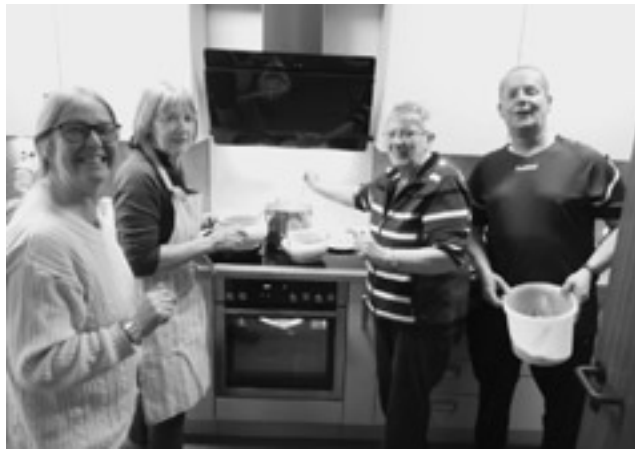
Voll im Einsatz: eines der Kochteams des „Leckeren Donnerstags“ in Cäciliengraden.

Gerne können wir auch persönlich darüber ins Gespräch kommen. Nehmen Sie Kontakt zu uns auf – wir freuen uns auf Sie!