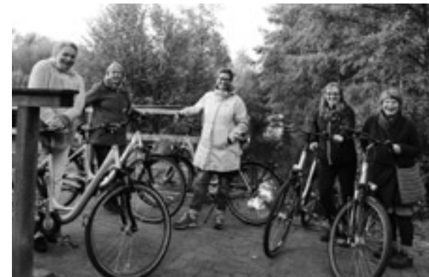
Ein Genuss für Körper und Seele: die Frauen der Meditationsgruppe gönnten sich eine Auszeit.

Tage in der Historisch-Ökologischen Bildungsstätte in Papenburg. Schon die Anfahrt durch die herbstliche Landschaft war ein Er-lebnis. Es folgten ereignisreiche Tage mit Meditationen, Spaziergängen, gemeinsa-men Spielen, Radtouren, guten Gesprä-