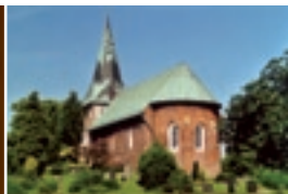
St. Magnus-Kirche Sande