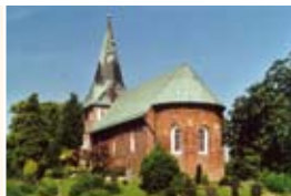
St. Magnus-Kirche Sande